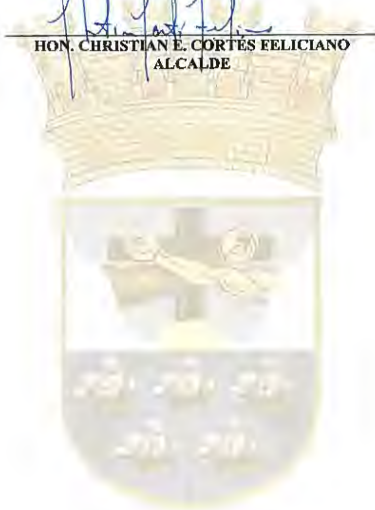
HON. CHRISTIAN E. CORTÉS FELICIANO ALCALDE

APROBADA POR EL ALCALDE DE AGUADA PUERTO RICO, EL 2 DE NOVIEMBRE DE 2021.