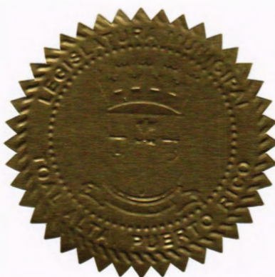
Secretaría Legislatura Municipal